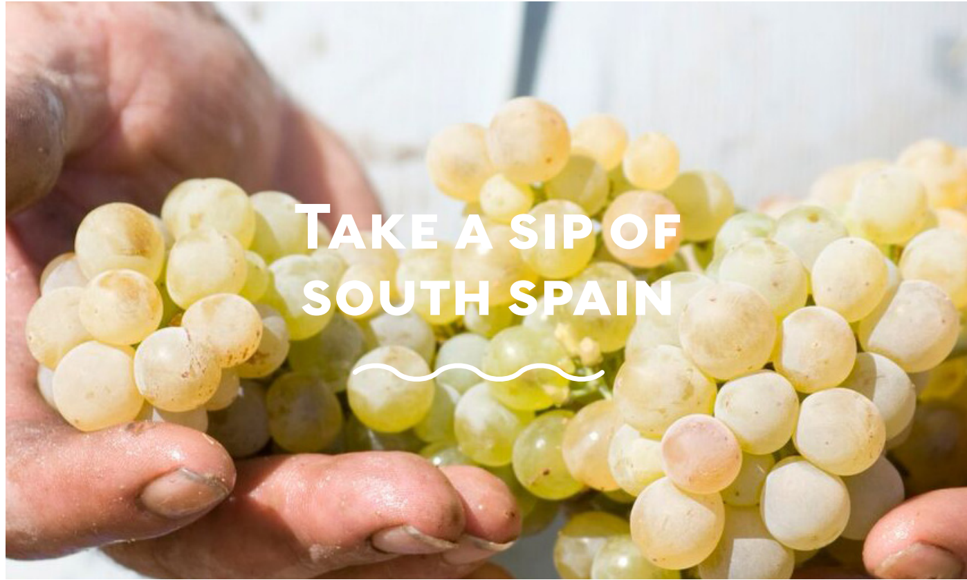
Trauben aus Südsanien.

“GENIESSEN SIE EINEN TROPFEN SÜDSANIENS MIT RUM DER DESTILLERÍAS LA CORDOBESA, DIE MIT SEHR ALTEN KUPFERBRENNBLASEN AUSGESTATTET IST, DIE NOCH HEUTE ZUR TRADITIONIELLEN DESTILLATION GENUTZT WERDEN.”