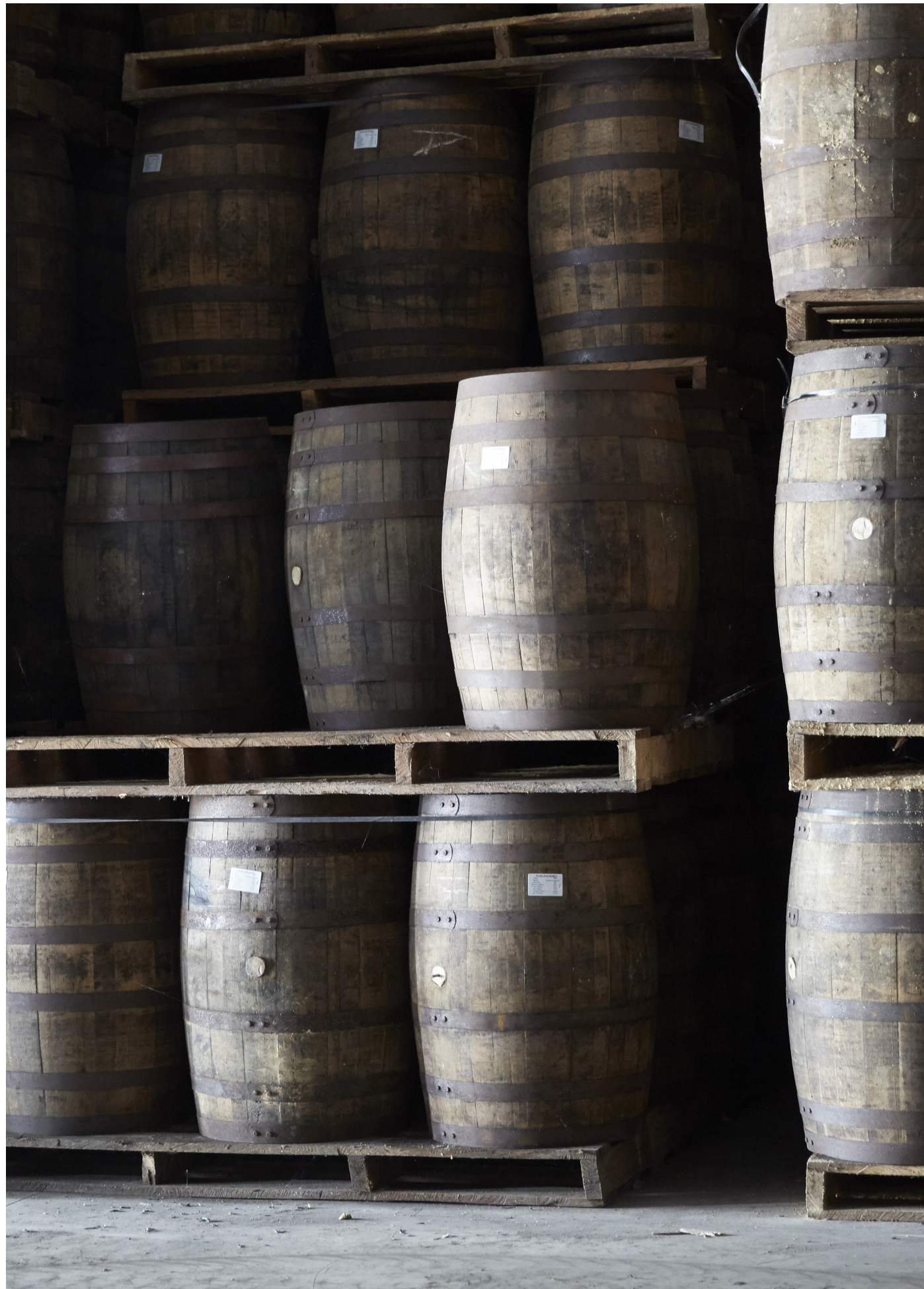
Worthy Parks Fasslager