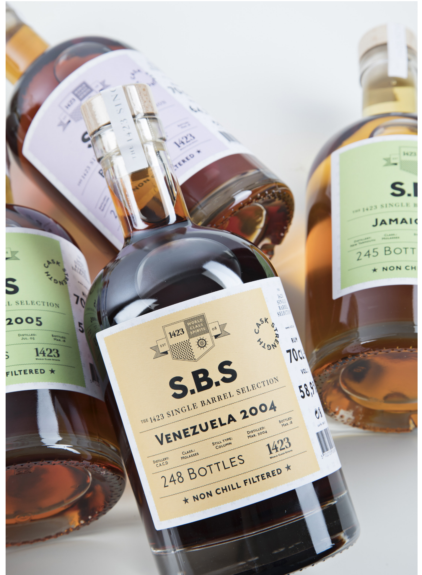
Single Barrel Selection von 1423