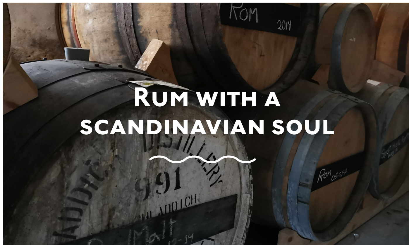
Fässer bei Enghaven Rum Distillery

“EINE SMALL BATCH DESTILLERIE AUS DEM NORDEN DÄNEMARKS, DIE AUSSCHLIESSLICH AUF DIE PRODUKTION VON POTSTILL RUM UND FASSEXPERIMENTE FOKUSSIERT.”