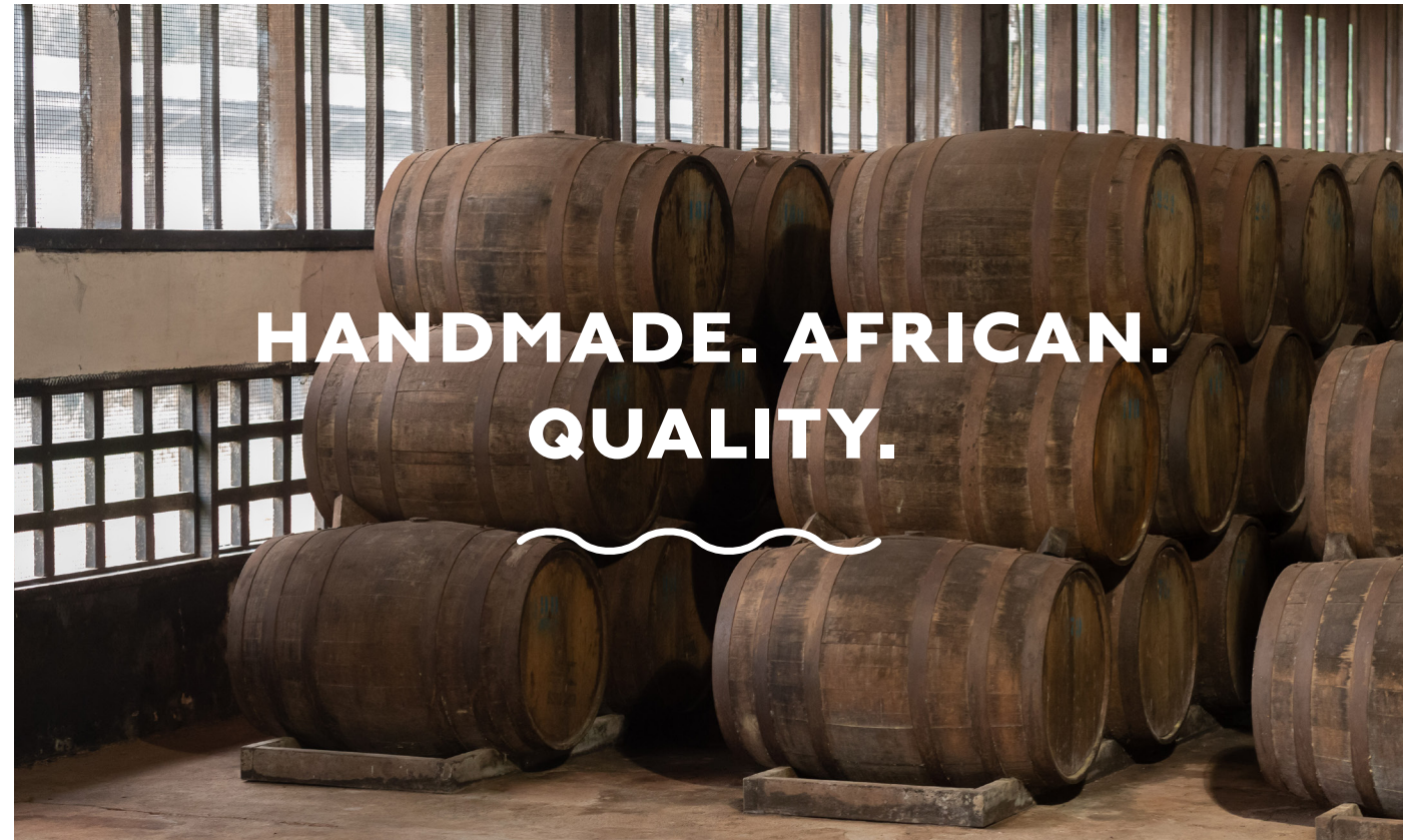
Trauben aus Südsanien.

“VON CONNOISSEURS AUF DER GANZEN WELT GESCHÄTZT, IST DER GESCHMACK, DIE QUALITÄT UND DER CHARAKTER VON MIM CASHEW BRANDY – RUND FRISCH UND SEHR SCHMACKHAFT.”