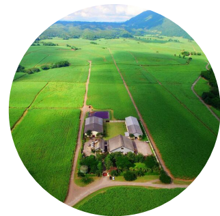
Worthy Park Estate auf Jamaika