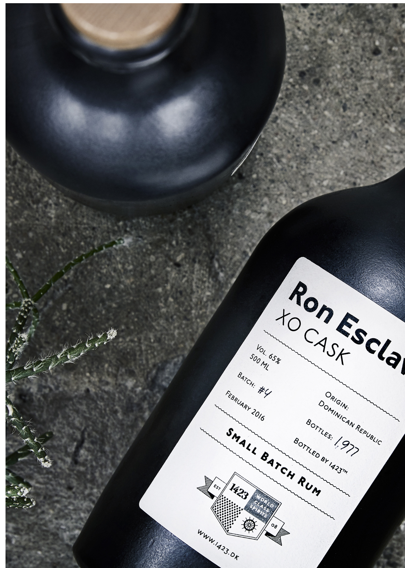
Ron Esclavo XO Cask von 1423

Ron Esclavo „der Rum der Sklaven“ gedenkt der Sklaven, die den höchsten Preis dafür bezahlen mussten, dass der Rum sich bereits im ersten Produktionsjahr rasant ausgebreitet hat, und derer, die aufstanden und gegen die Sklaverei kämpften. Auf sie alle stoßen wir heute an. Ron Esclavo from slavery to bravery!